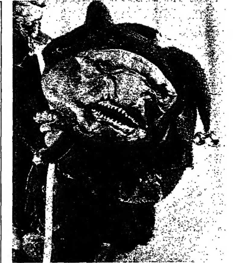
الشيخ في فيلم عين القطعة، كما تصورته كارلو رامالدي